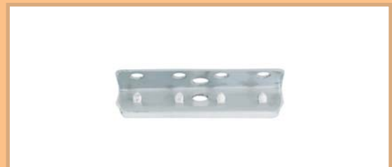
Metallklammer 50 mm breit Art.-Nr. 360 022